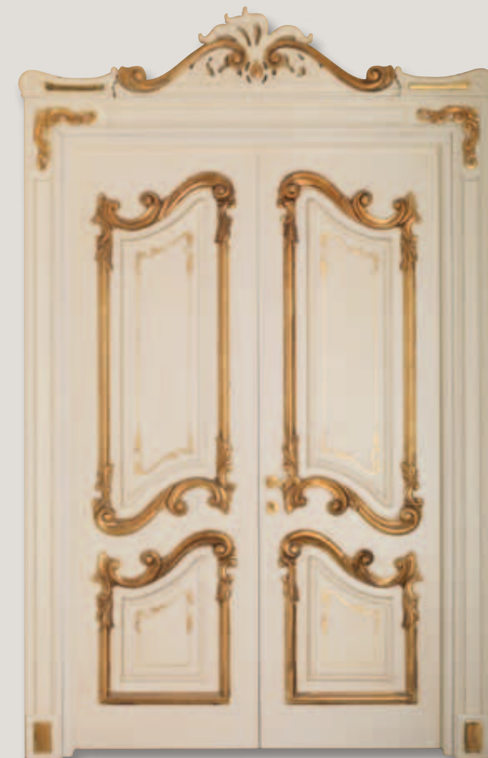
Mod. PALAZZO REALE 2/A patinato con oro ossido