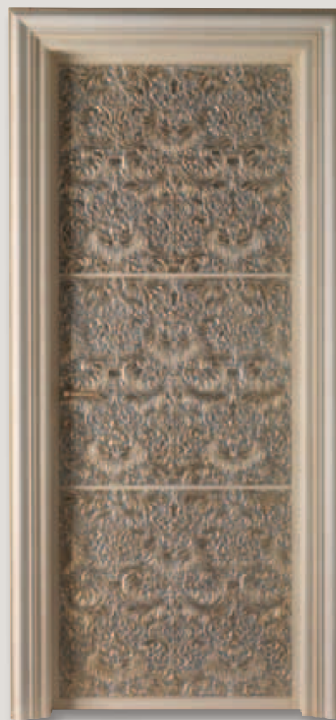
Mod.ARBAT oro patina argento