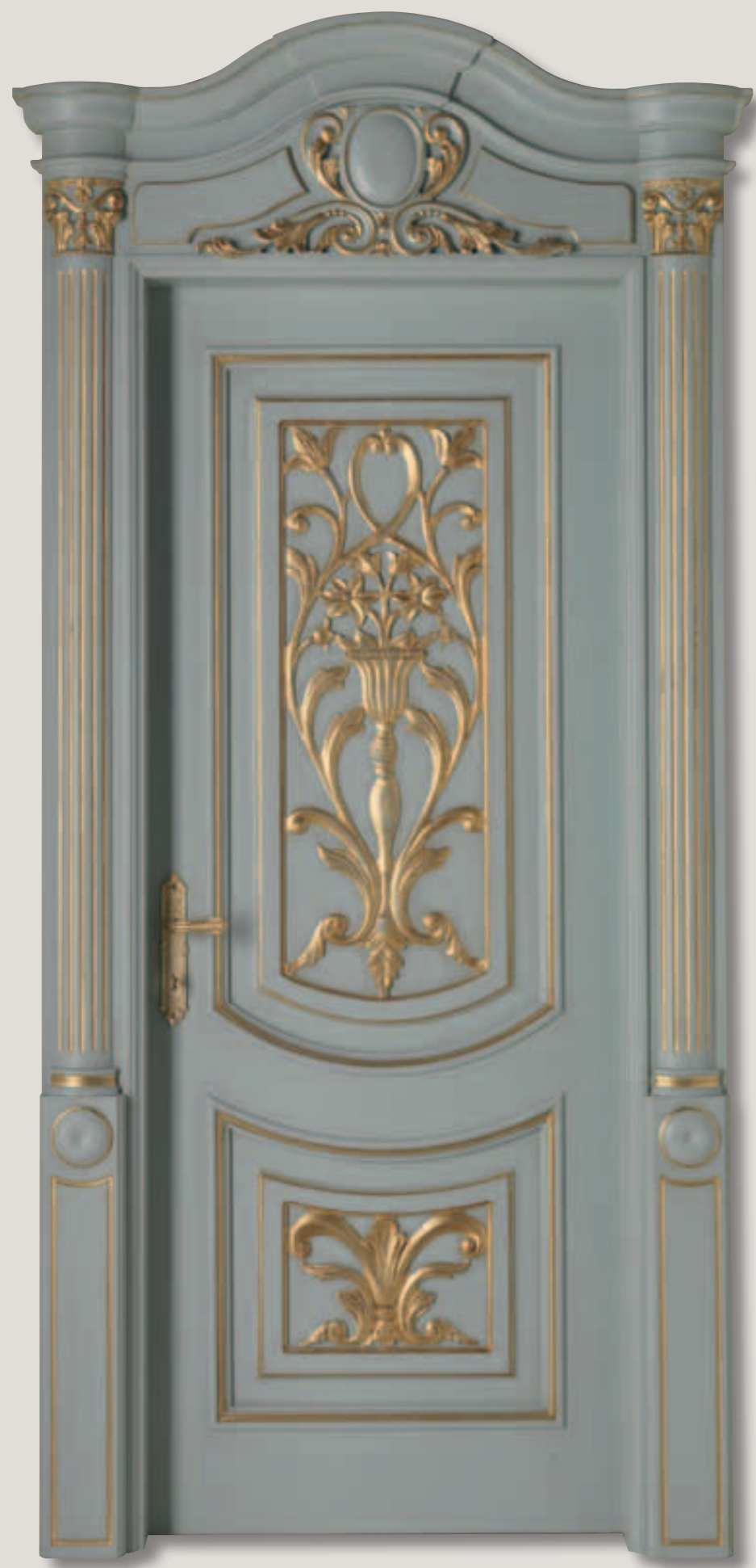
Mod. LUIGI XVI finitura laccato sfumato azzurro con oro