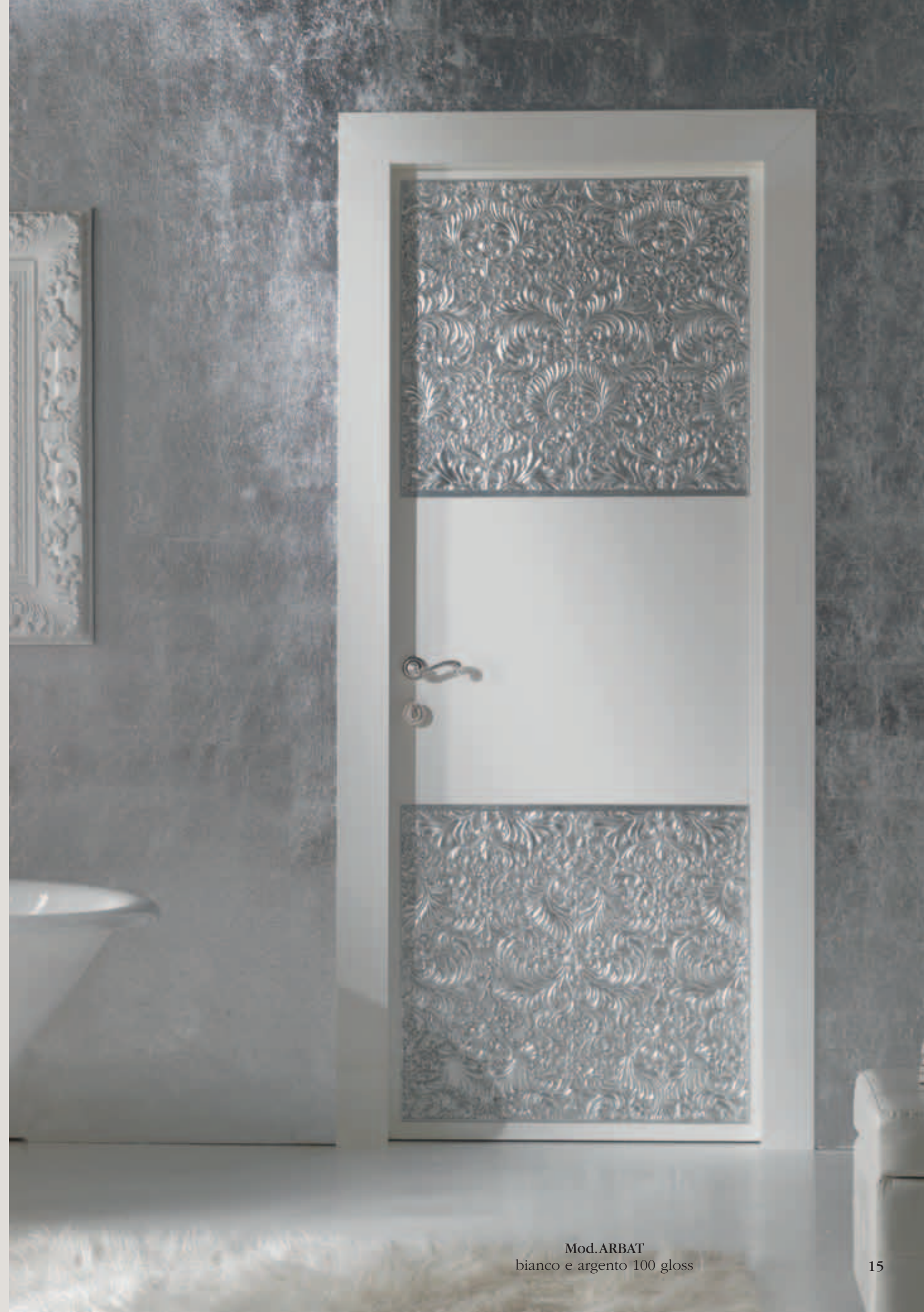
Mod.ARBAT bianco e argento 100 gloss