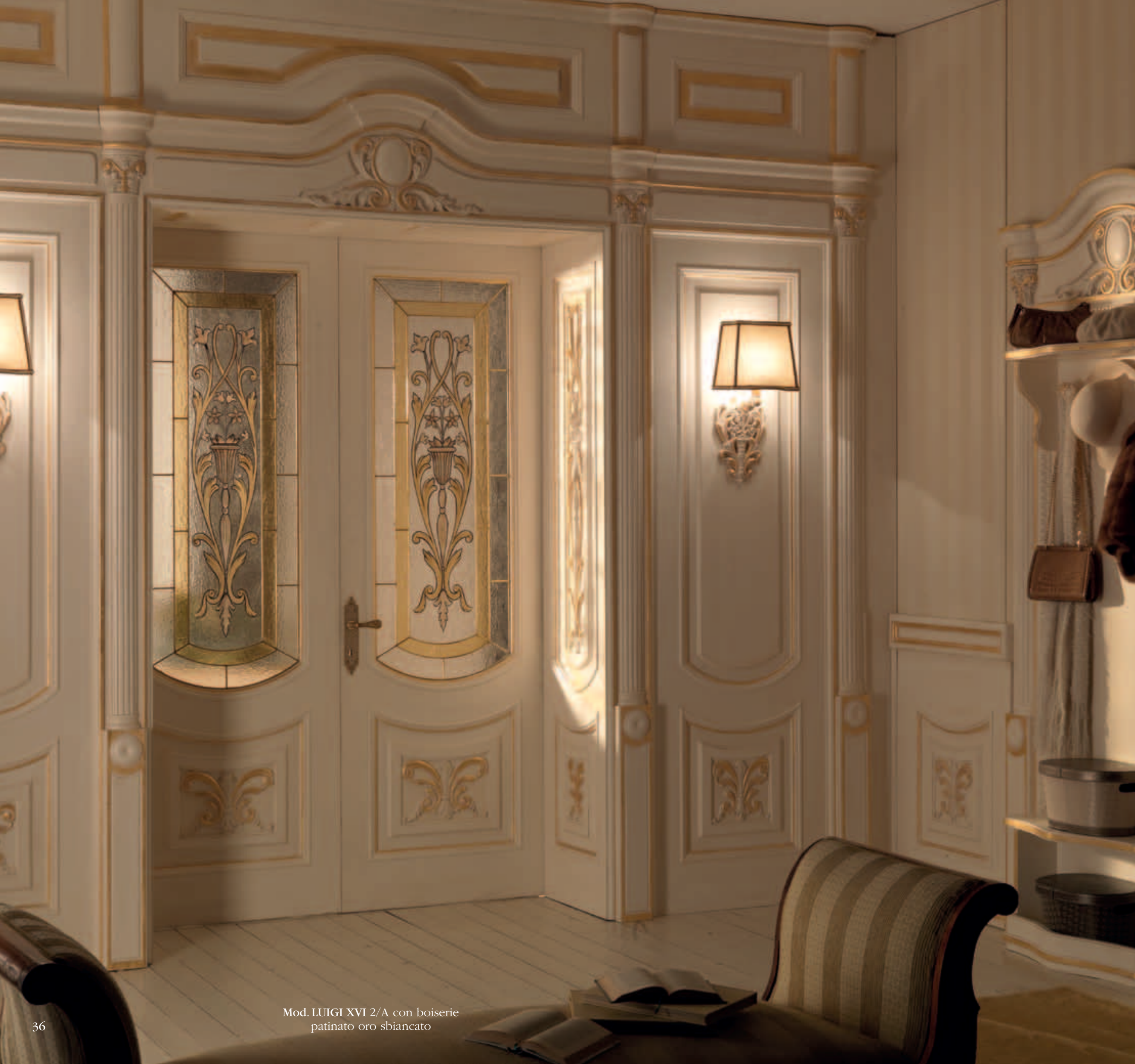
Mod. LUIGI XVI 2/A con boiserie patinato oro sbiancato