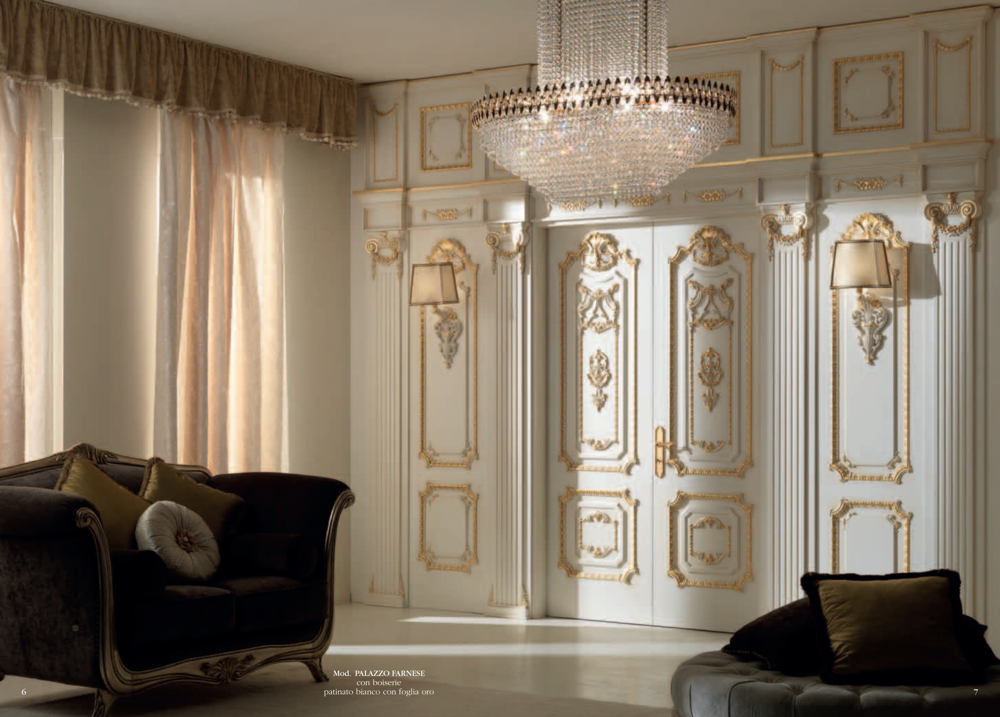
Mod. PALAZZO FARNESE con boiserie patinato bianco con foglia oro