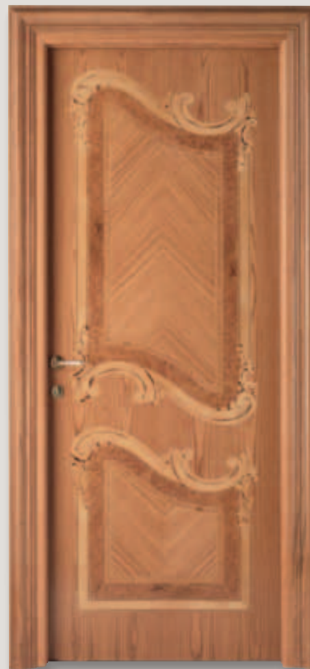
Mod. PALAZZO REALE rovere finitura maggiolino lucido