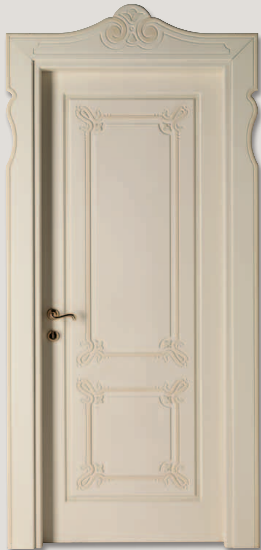
Mod. GUINIGI veneziano patinato