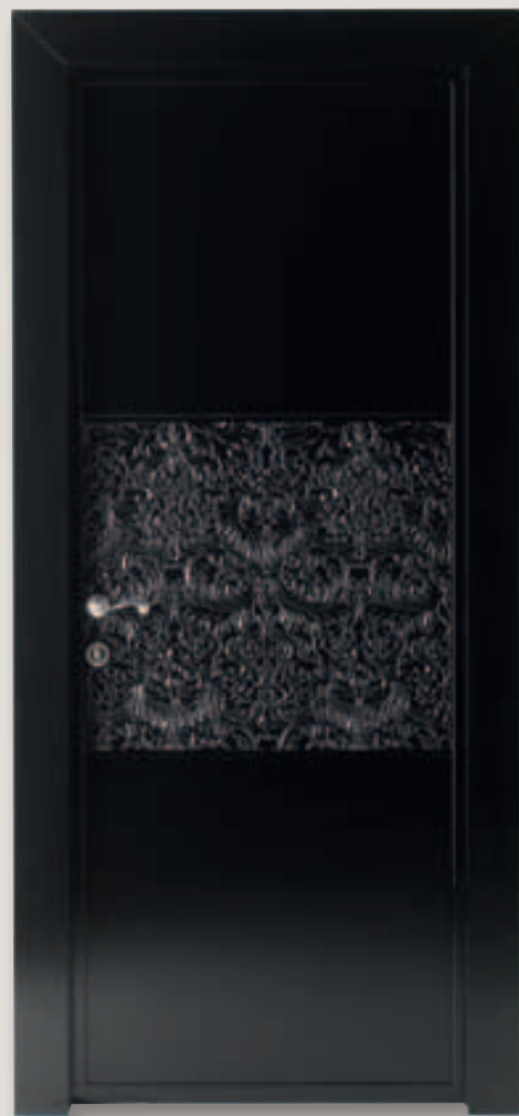
Mod.ARBAT nero lucido 100 gloss