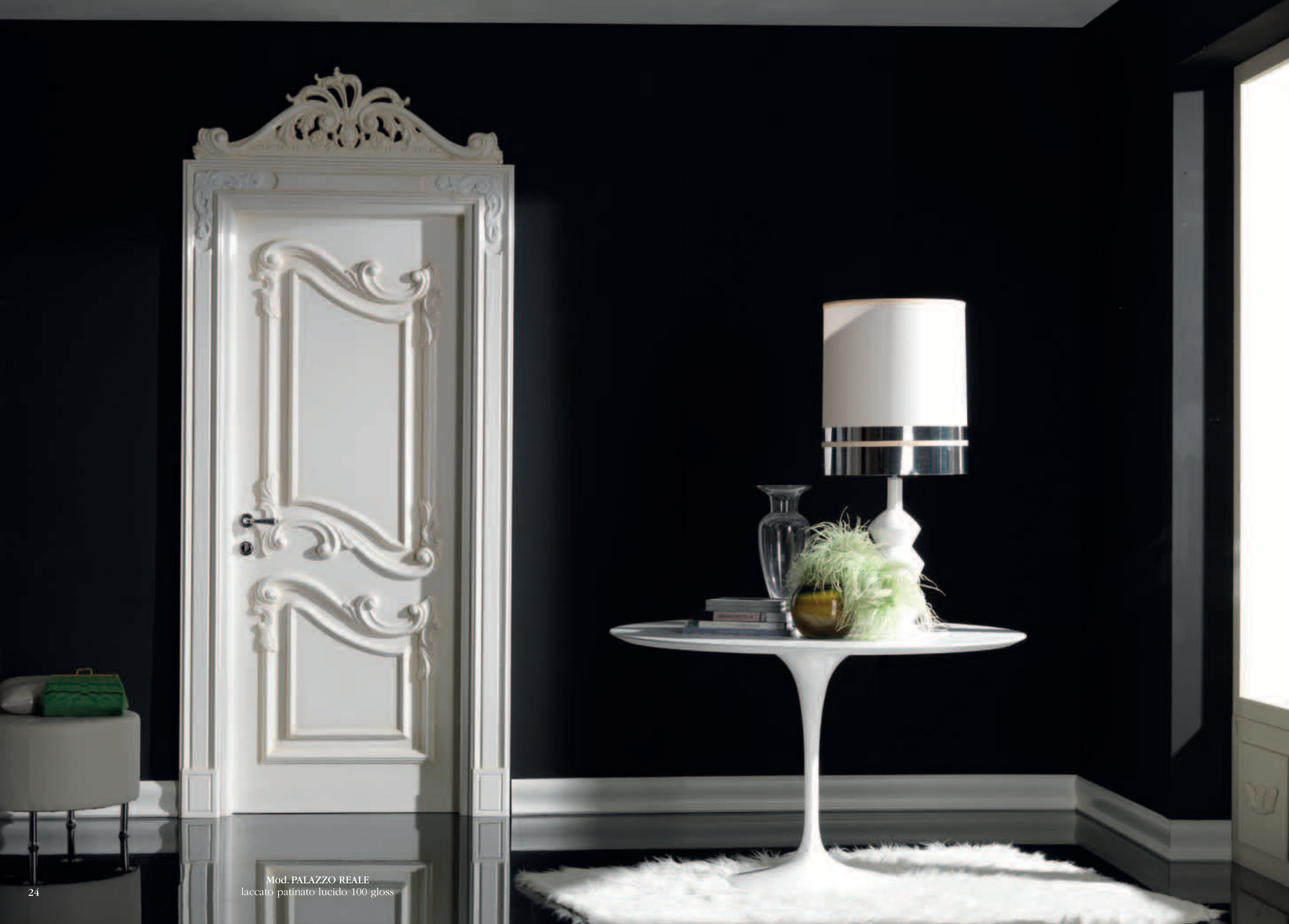
Mod. PALAZZO REALE laccato patinato lucido 100 gloss