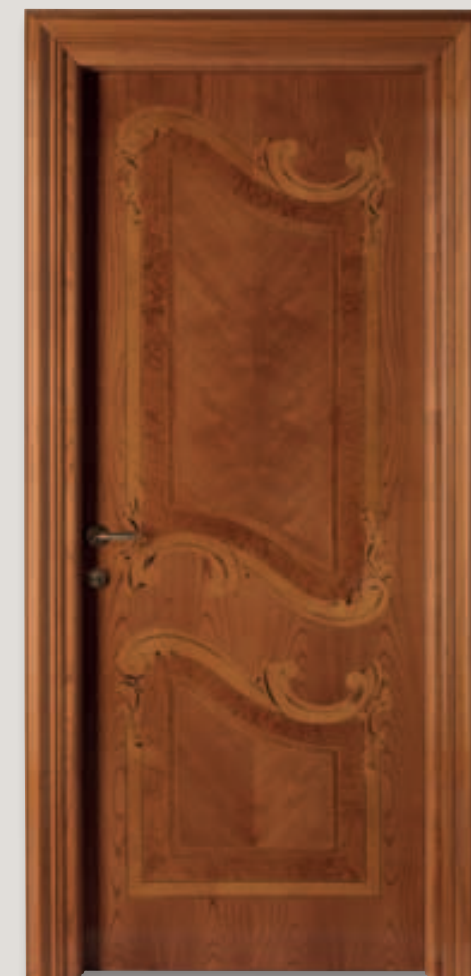
Mod. PALAZZO REALE ciliegio finitura maggiolino lucido