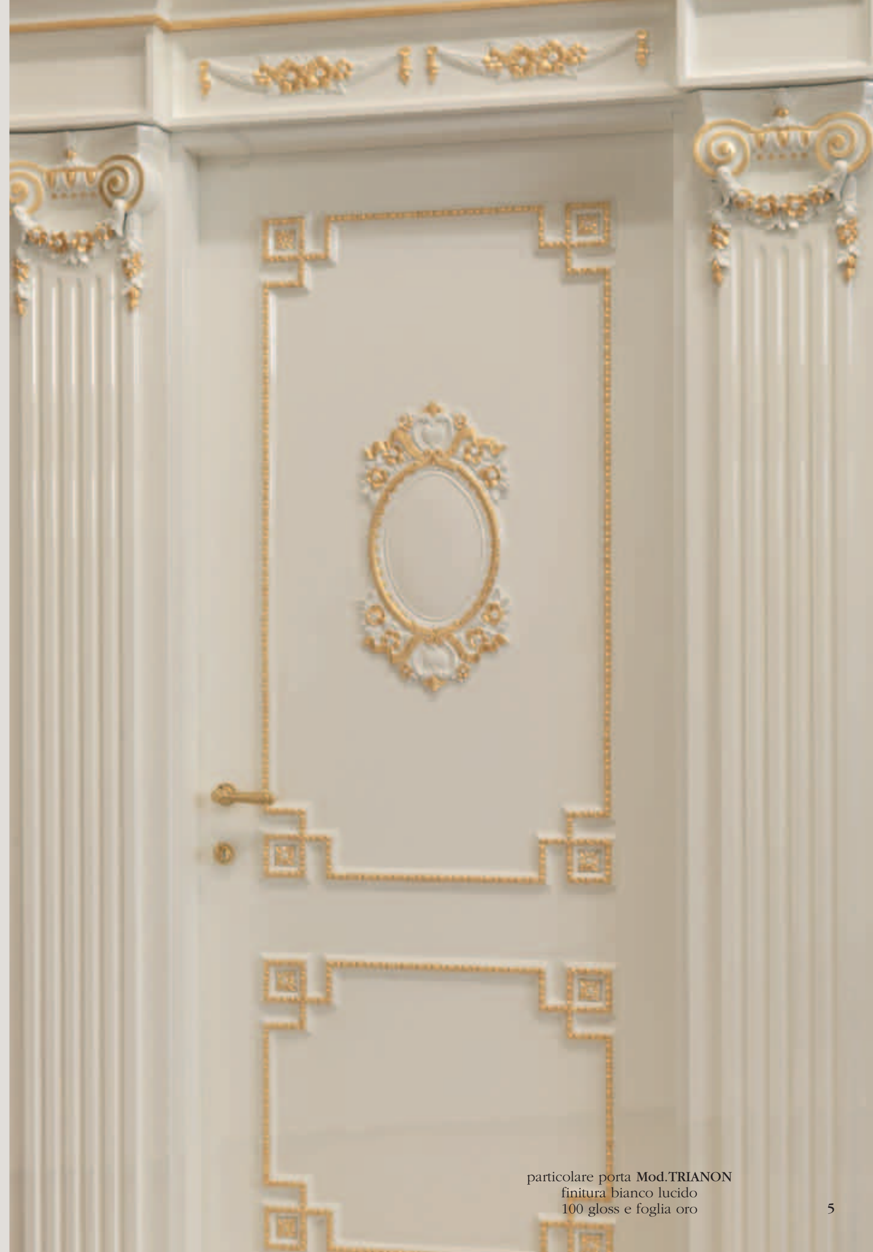
particolare porta Mod.TRIANON finitura bianco lucido 100 gloss e foglia oro