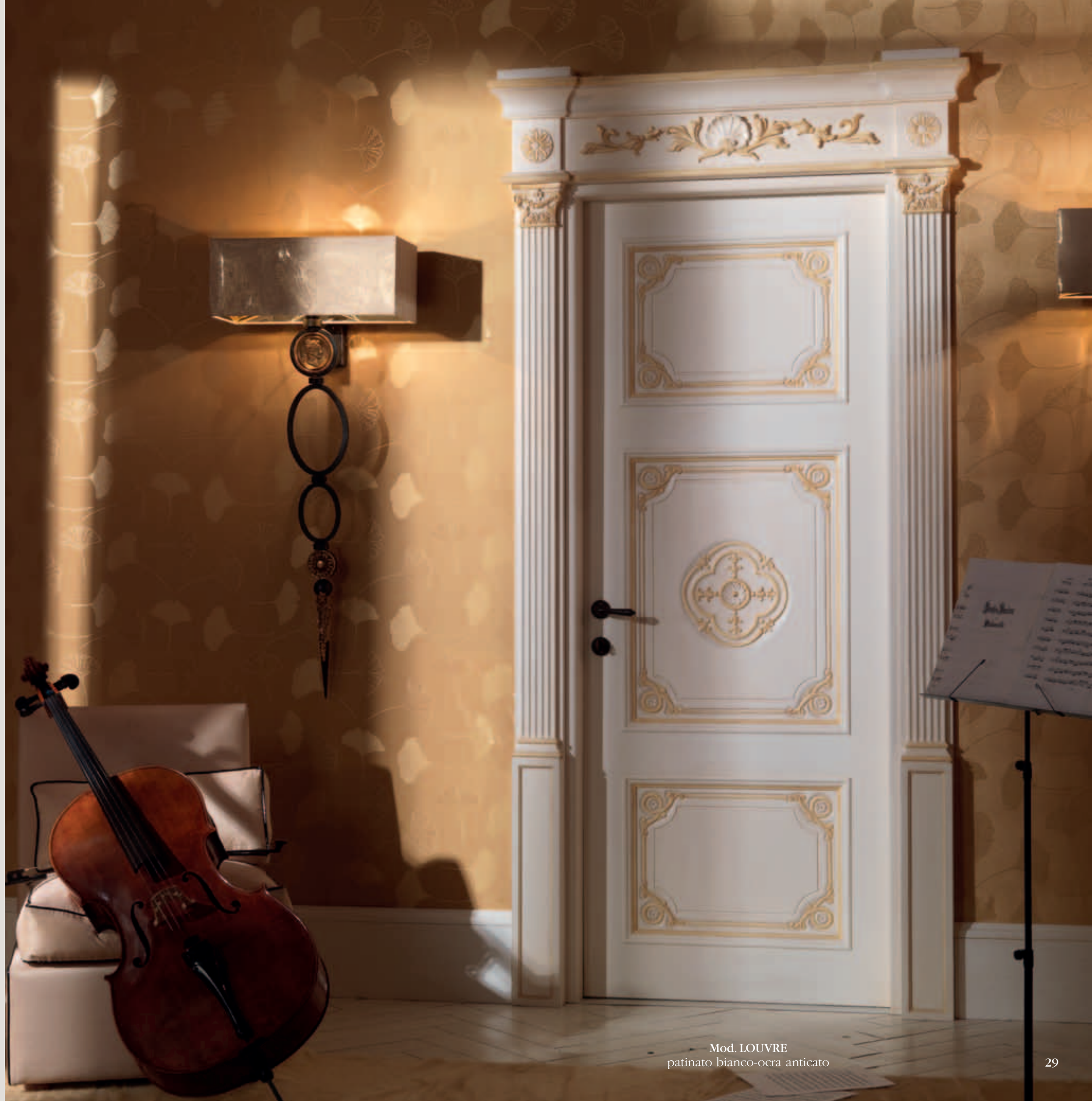
Mod. LOUVRE patinato bianco-ocra antico