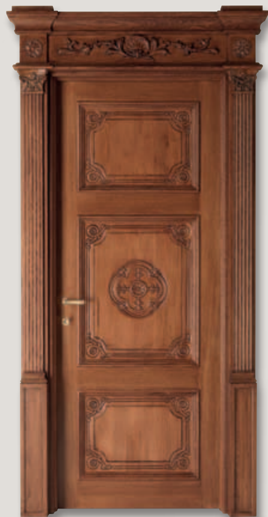
Mod. LOUVRE rovere patinato