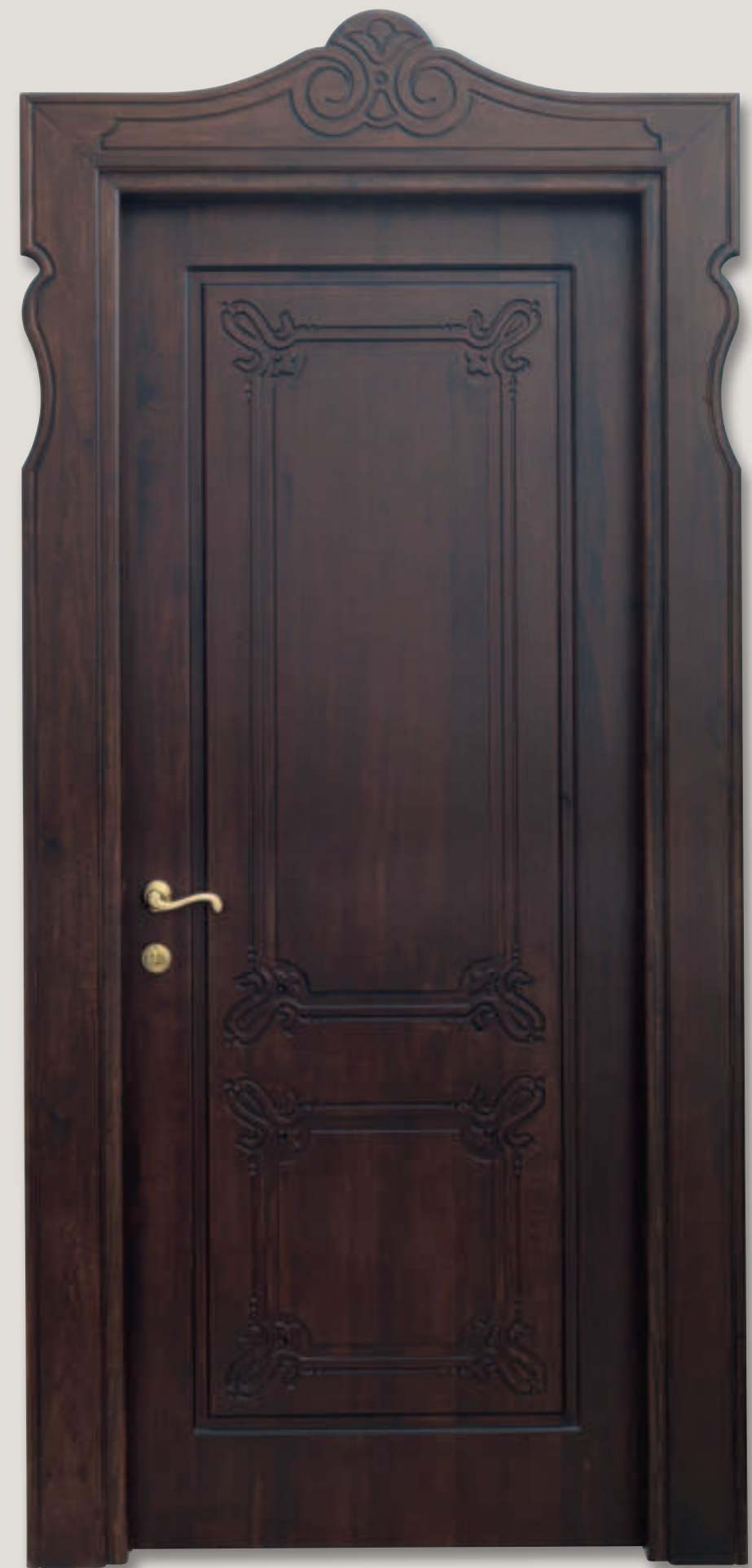
Mod. VILLA GUINIGI toulipier scuro