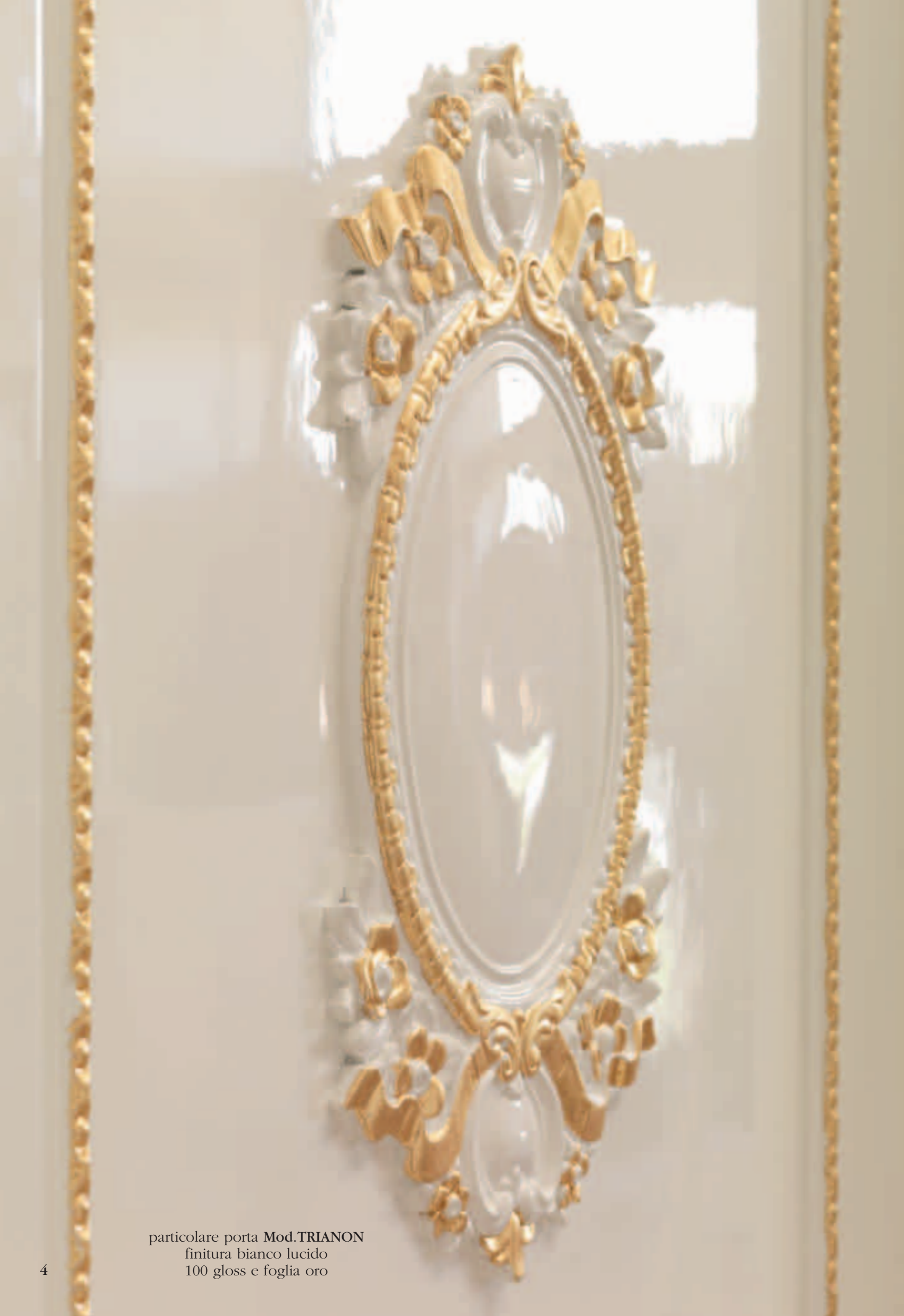
particolare porta Mod.TRIANON finitura bianco lucido 100 gloss e foglia oro