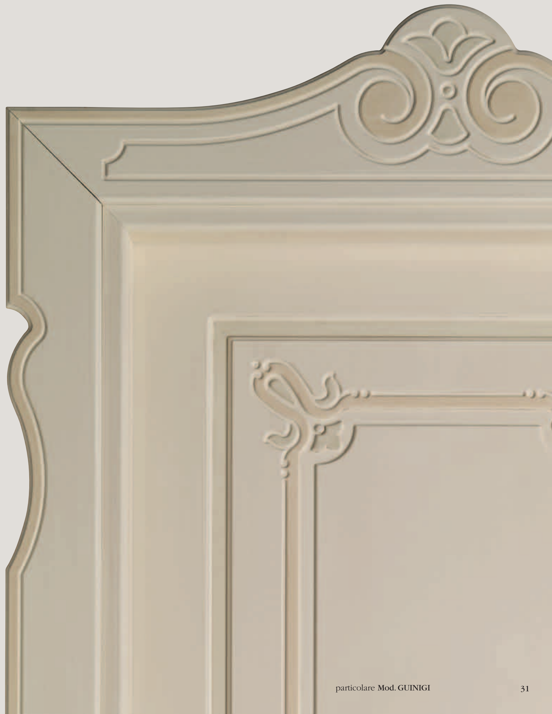
particolare Mod. GUINIGI