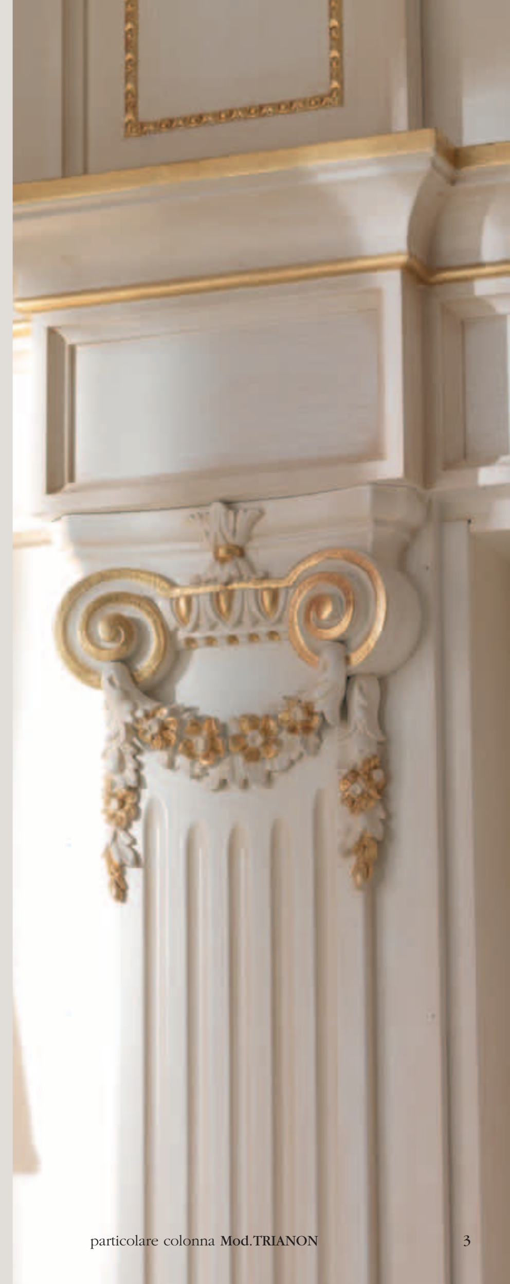
particolare colonna Mod.TRIANON