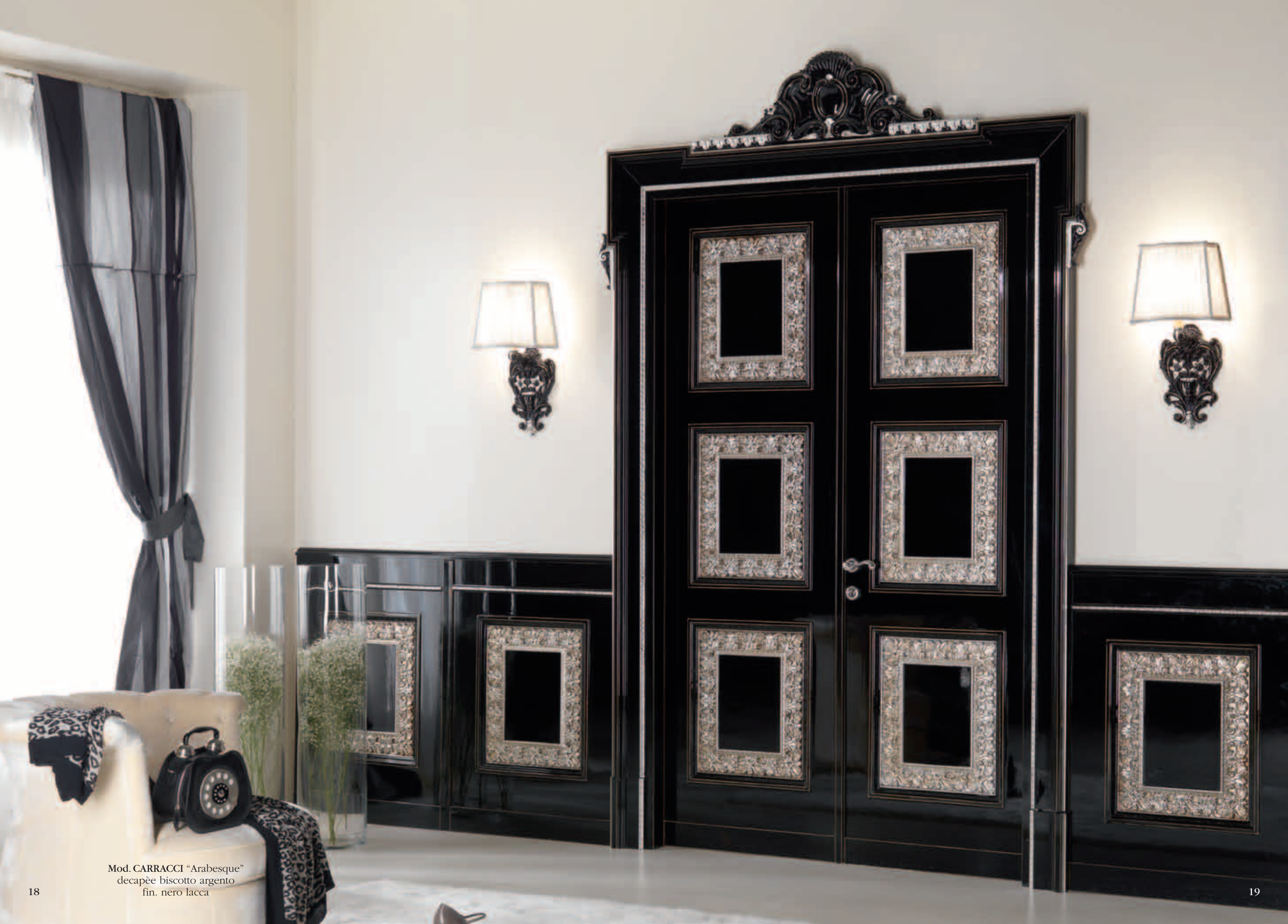
Mod. CARRACCI "Arabesque" decapèe biscotto argento fin. nero lacca