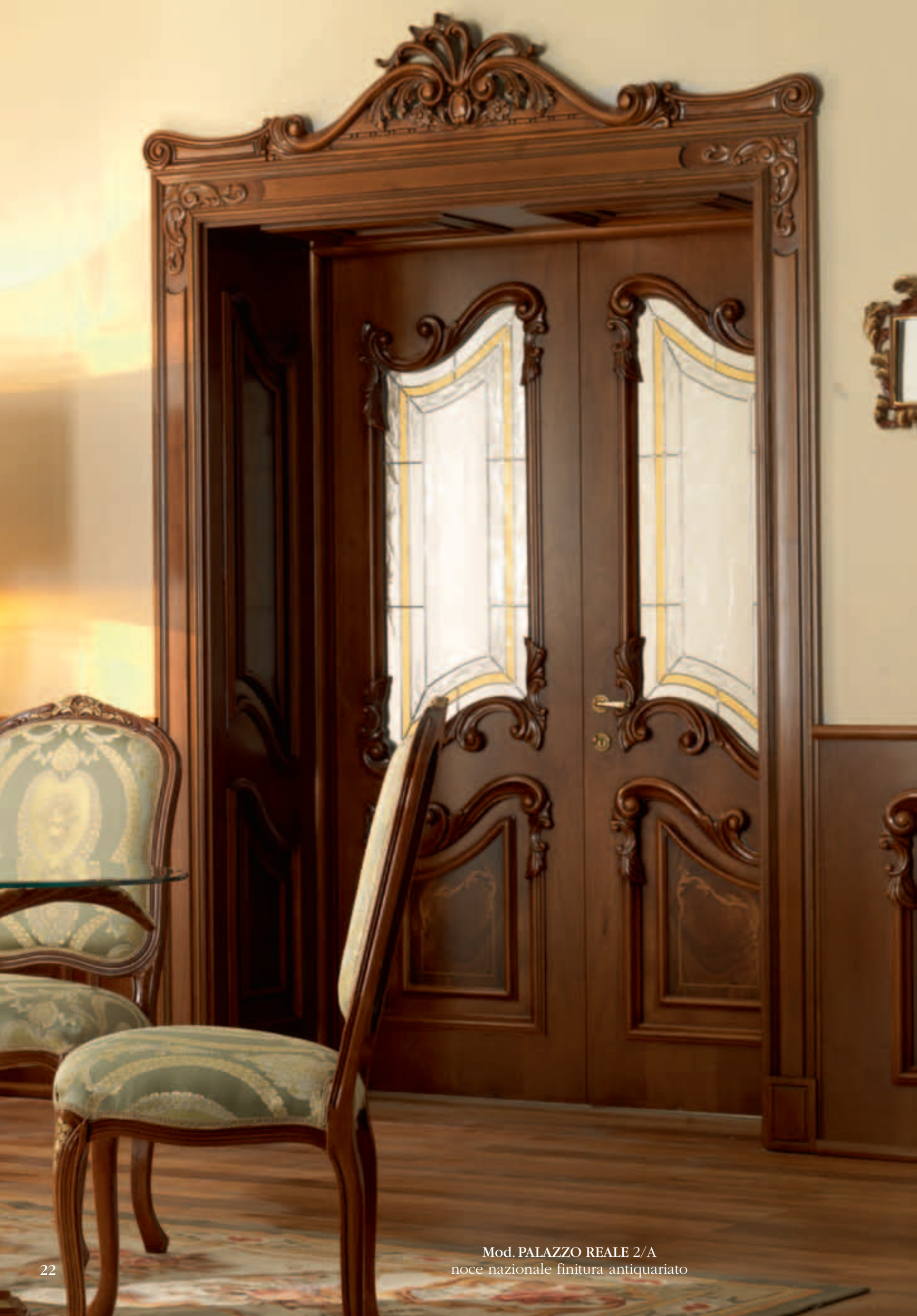
Mod. PALAZZO REALE 2/A noce nazionale finitura antiquariato