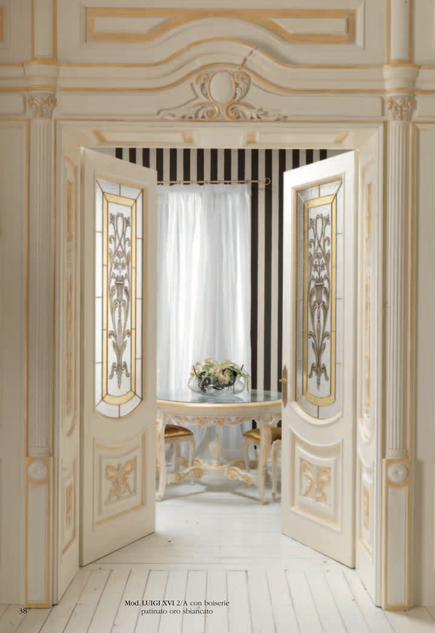
Mod. LUIGI XVI 2/A con boiserie patinato oro sbiancato