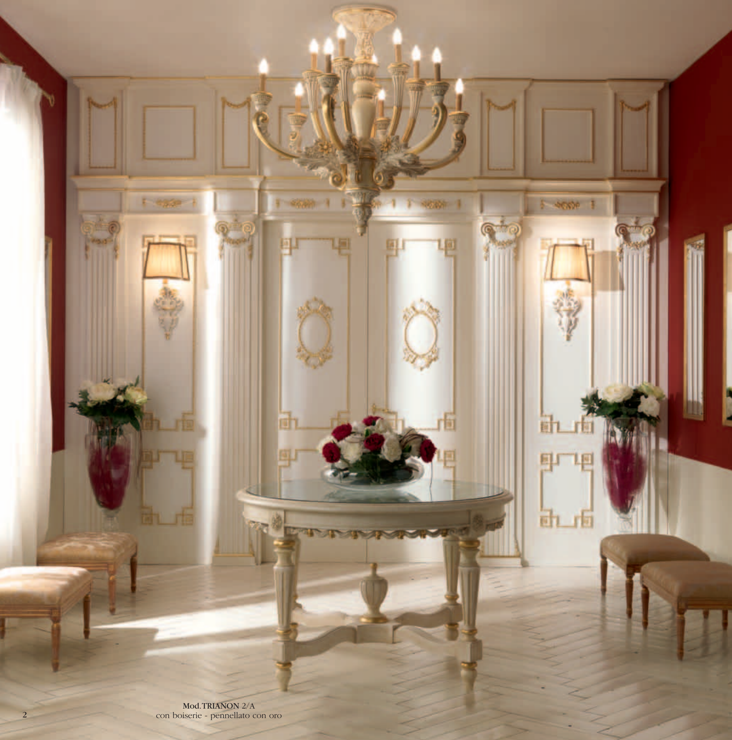
Mod.TRIANON 2/A con boiserie - pennellato con oro