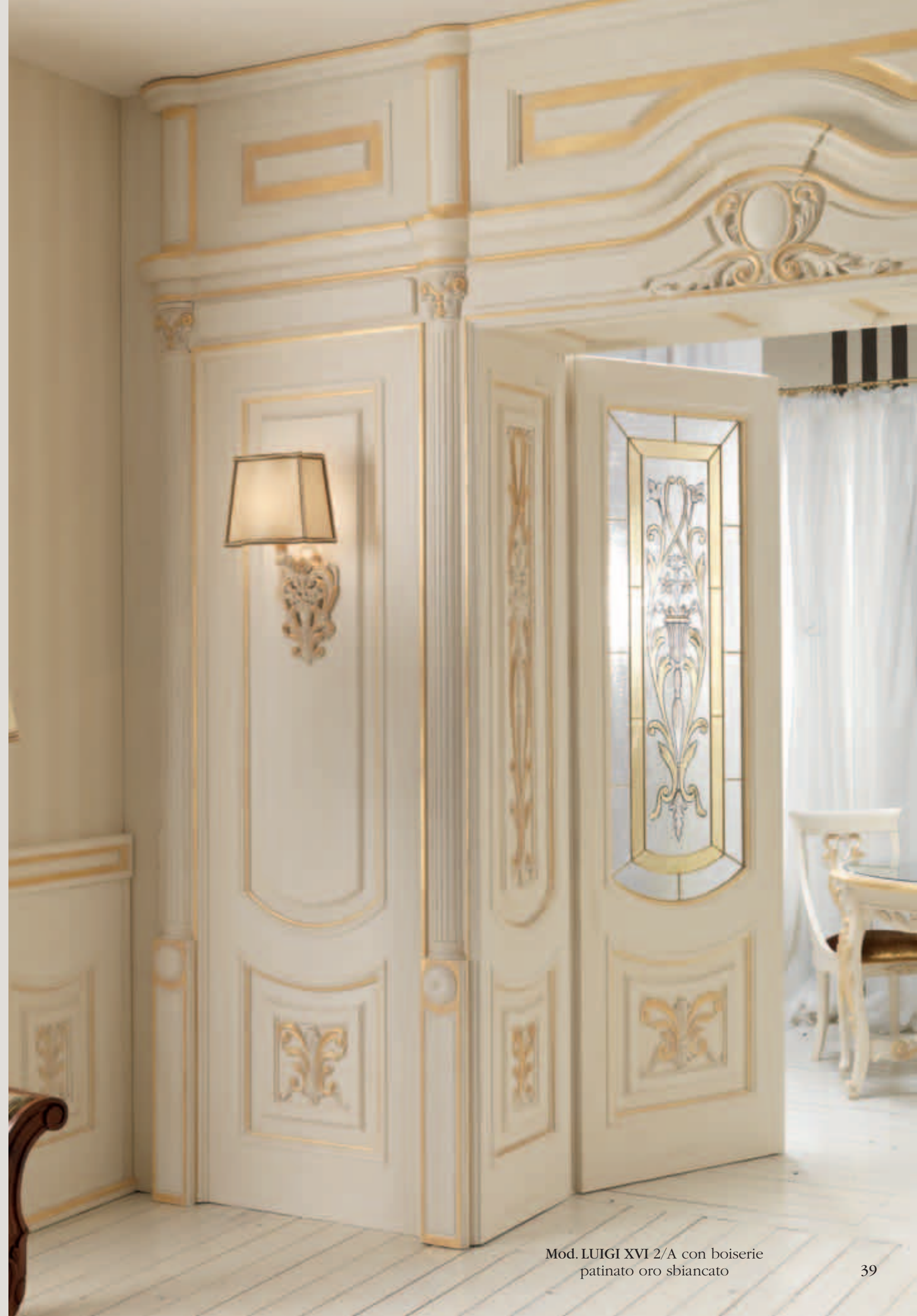
Mod. LUIGI XVI 2/A con boiserie patinato oro sbiancato