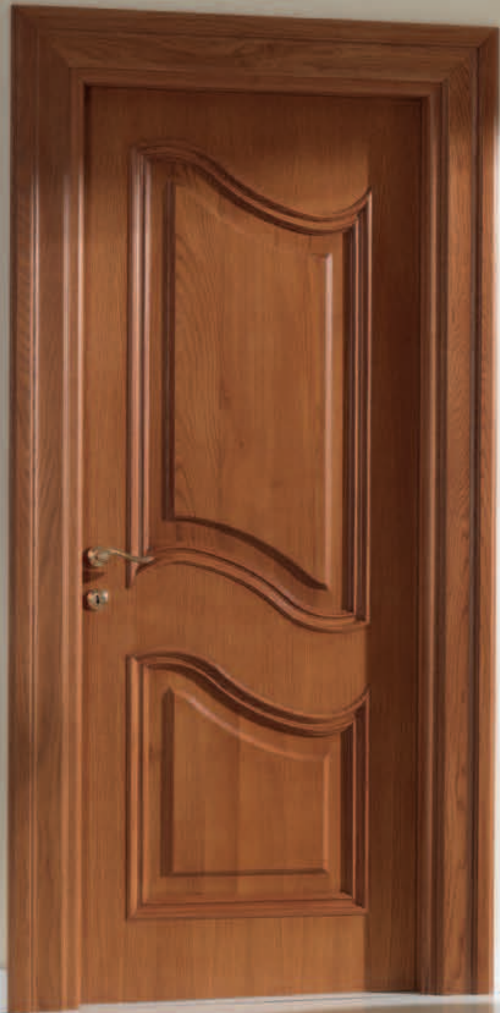
Mod. PALAZZO REALE rovere medio patinato