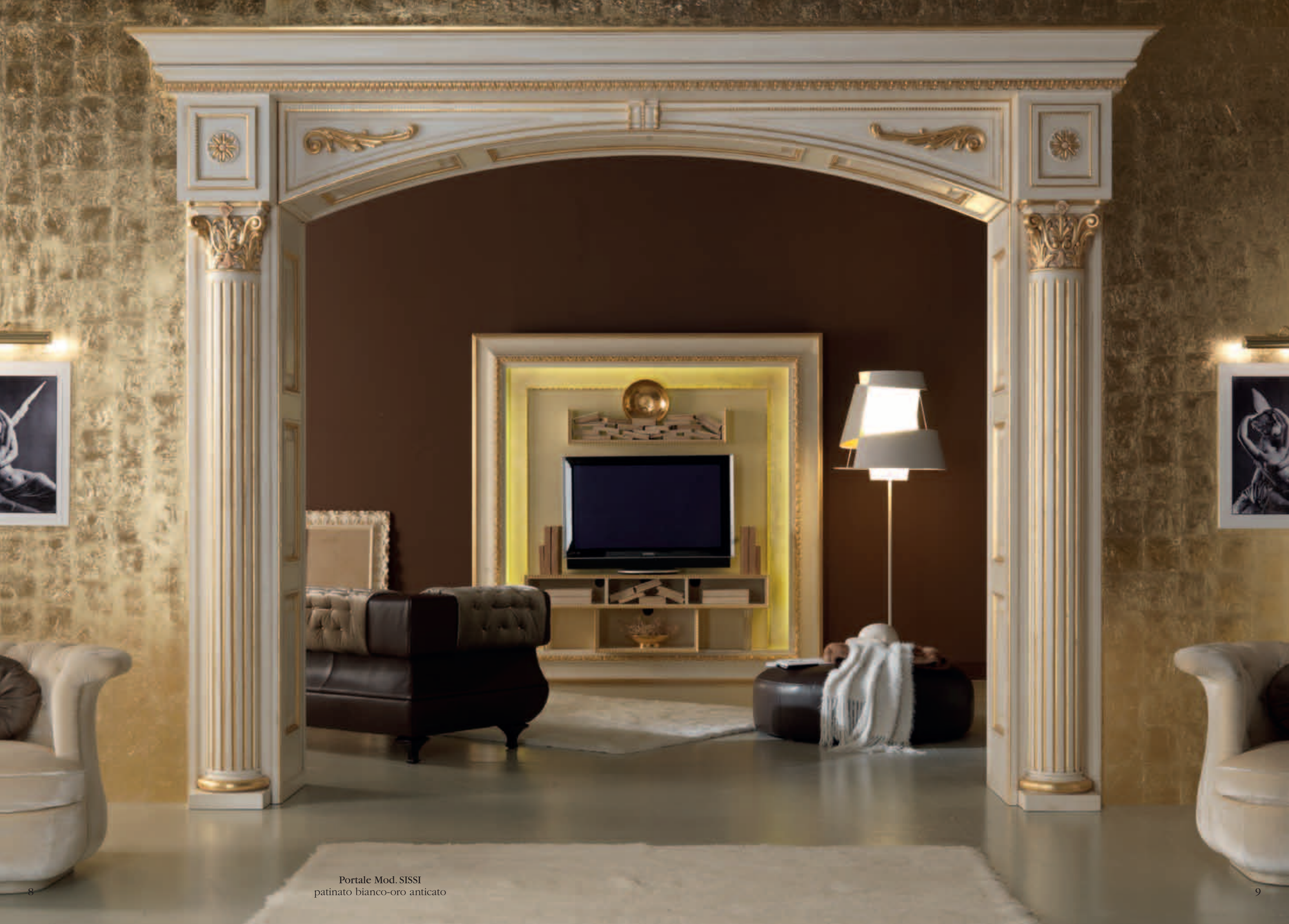
Portale Mod. SISSI patinato bianco-oro anticato