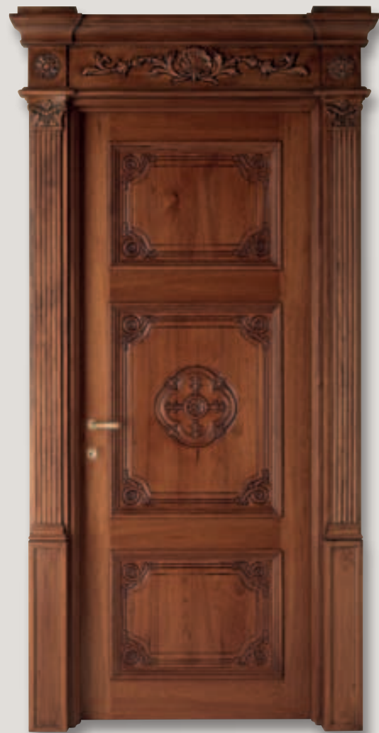
Mod. LOUVRE noce siberiano patinato