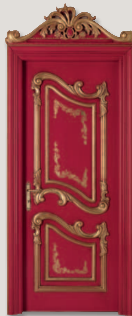
Mod. PALAZZO REALE rosso lacca e oro