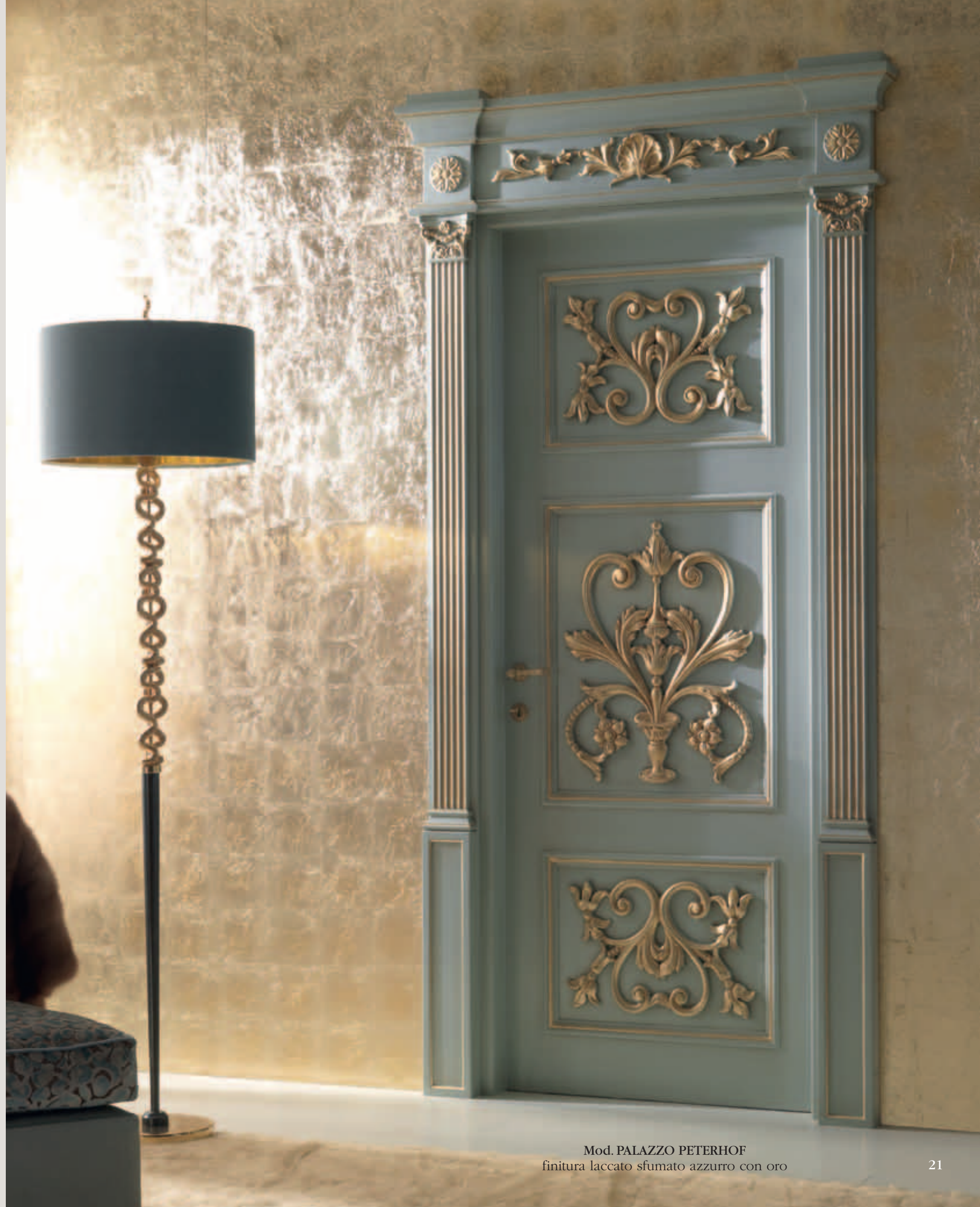
Mod. PALAZZO PETERHOF finitura laccato sfumato azzurro con oro