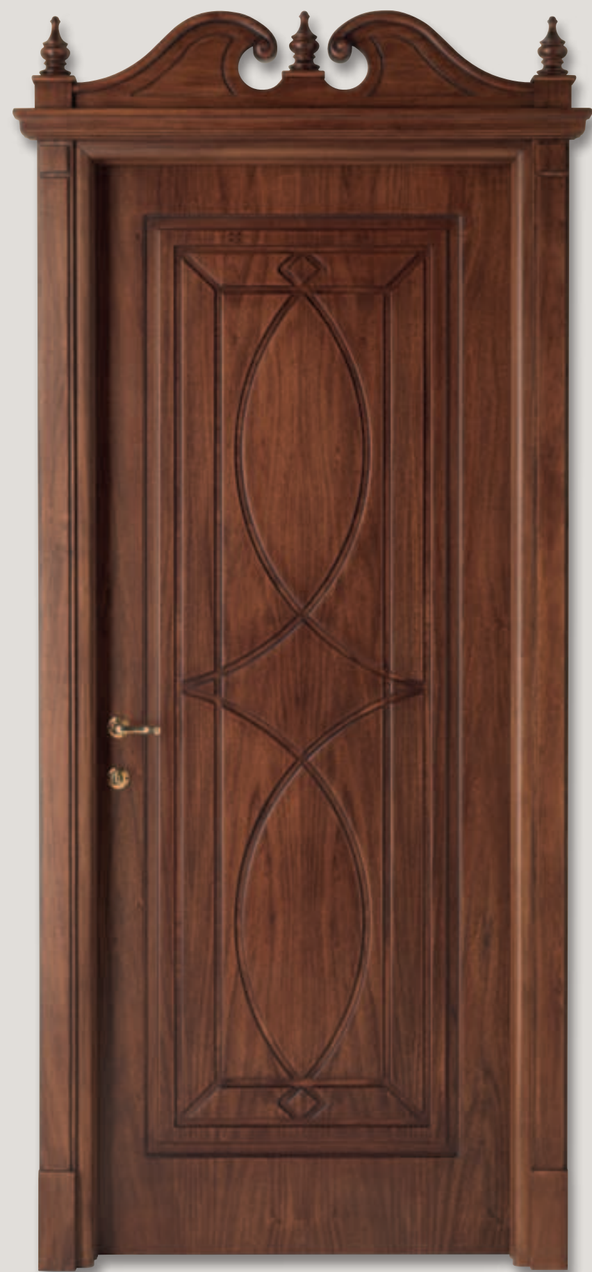
Mod. WINDSOR toulipier